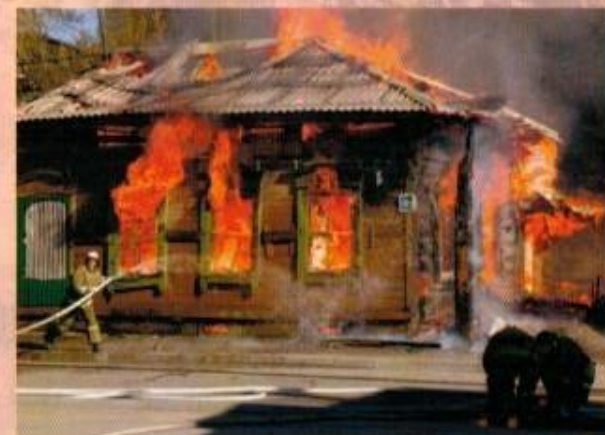
В этом доме в поселке "Ударник" Ангарского района 2 января 2014 г. при пожаре погибли трое детей.